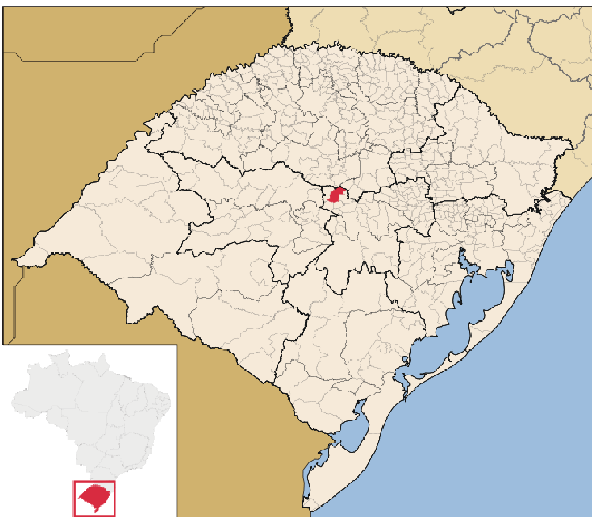
Figura 1 – Localização do município do Arroio do Tigre no Estado do Rio Grande do Sul.

A Comunidade Quilombola Linha Fão se localiza em Arroio do Tigre, uma cidade situada na região central do estado do Rio Grande do Sul (Figura. 01), a cerca de 250 km de distância de Porto Alegre. Conforme dados do IBGE(2010), o município de Arroio do Tigre possui cerca de 318 km 2 de área e 12. 648 habitantes.