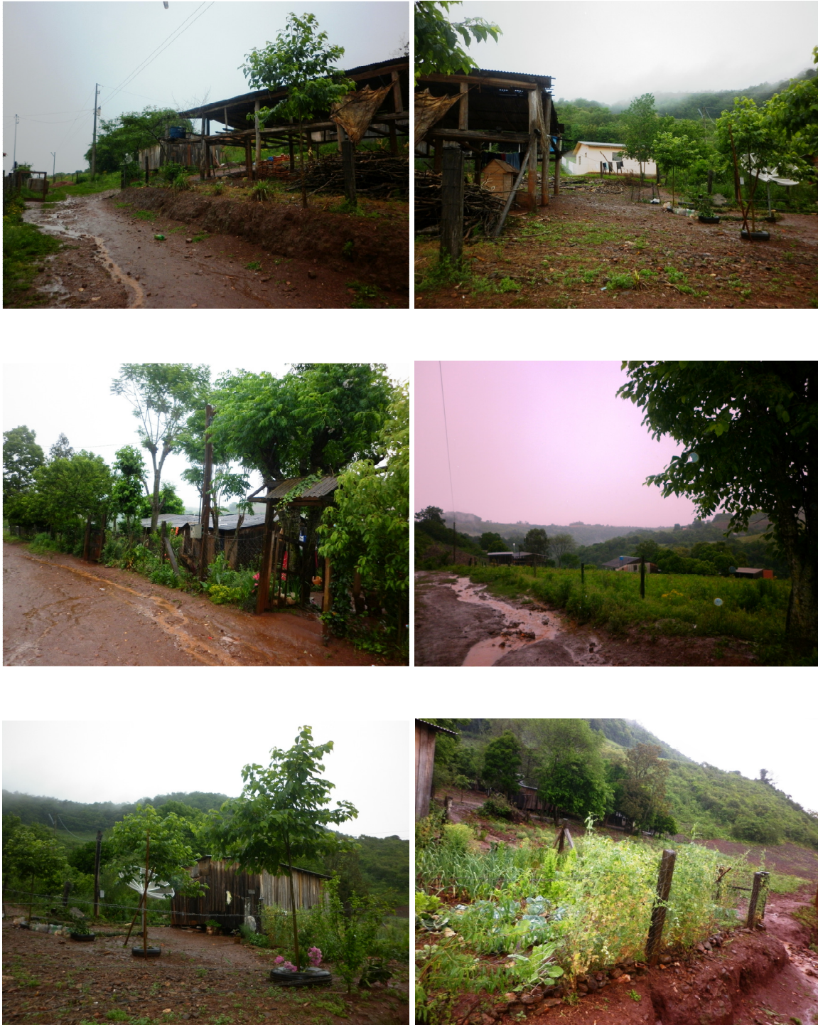
Figura 3 – Fotos da Comunidade Quilombola Linha Fão. Fonte: Cláucia Honnef (13/10/2011)

propriedades próximas, como agregados, sendo que na área de terra da comunidade moram somente quinze famílias.