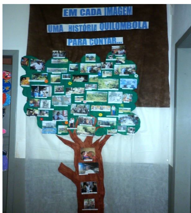
Figura 6 – Árvore confeccionada na escola VM, retratando as histórias quilombolas dos membros da Comunidade Linha Fão.

A partir do exposto por P4 verifica-se que na escola Sítio Novo é realizado o que, já pontuado por Nunes (2006) e Moura (2005) no capítulo um deste trabalho, é necessário em uma escola que recebe alunos oriundos de comunidades quilombolas, ou seja, uma interlocução entre escola e comunidade, em que a abordagem sobre o povo negro escravizado, sobre os quilombolas e sua cultura não seja só a dos livros, não se limite a eles e a uma versão negativa sobre a escravidão, mas sim se faz relevante a participação da comunidade quilombola na escola ou o contrário, para contar essa história (Figura 6), ressaltar os feitos positivos dos quilombolas ao país e as conquistas que tiveram neste após a escravidão e as reivindicações dos dias atuais.