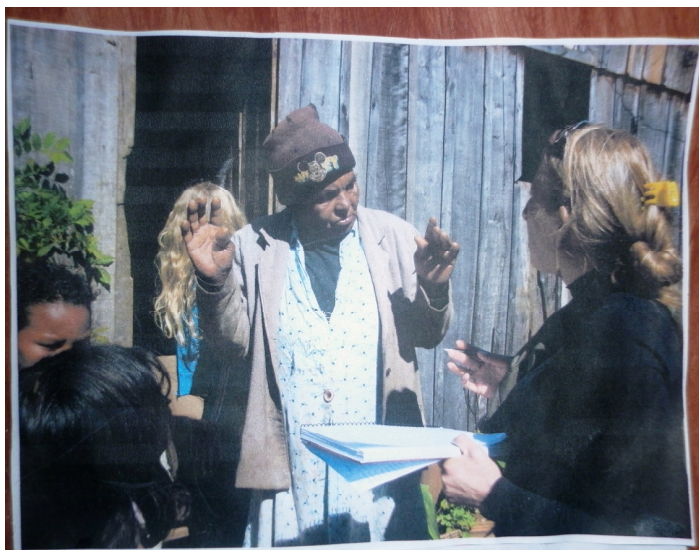
Figura 5 – Entrevista das professoras e alunos da escola VM, do Sítio Novo, com uma das senhoras mais idosas da Comunidade Quilombola Linha Fão.