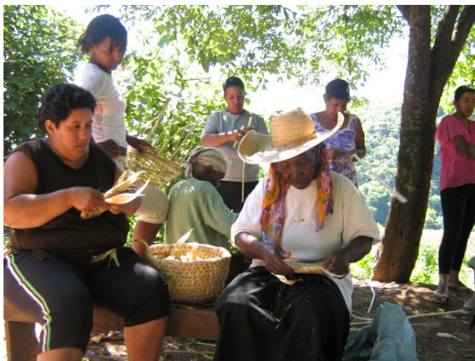
Figura 4 – Encontro para aprendizagem do artesanato em palha e taquara.

Verifica-se que a EMATER, enquanto instituição de extensão rural, que muitas vezes é uma das únicas entidades que chega a casa das pessoas do rural, buscou explicar a comunidade o significado de seu reconhecimento como remanescente quilombola, bem como buscou trabalhar e evidenciar aspectos na comunidade que representavam a cultura quilombola, como os cestos de cipó, taquara e palha que as mulheres idosas faziam e que as mais novas não sabiam produzir (Figura 4).