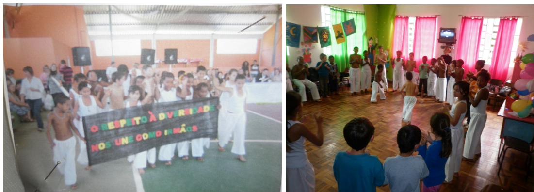
Figura 7 – Apresentação do Grupo de Dança de Capoeira da escola VM, do Sítio Novo, no Ginásio da Comunidade Sítio Alto e na sala da escola VM.