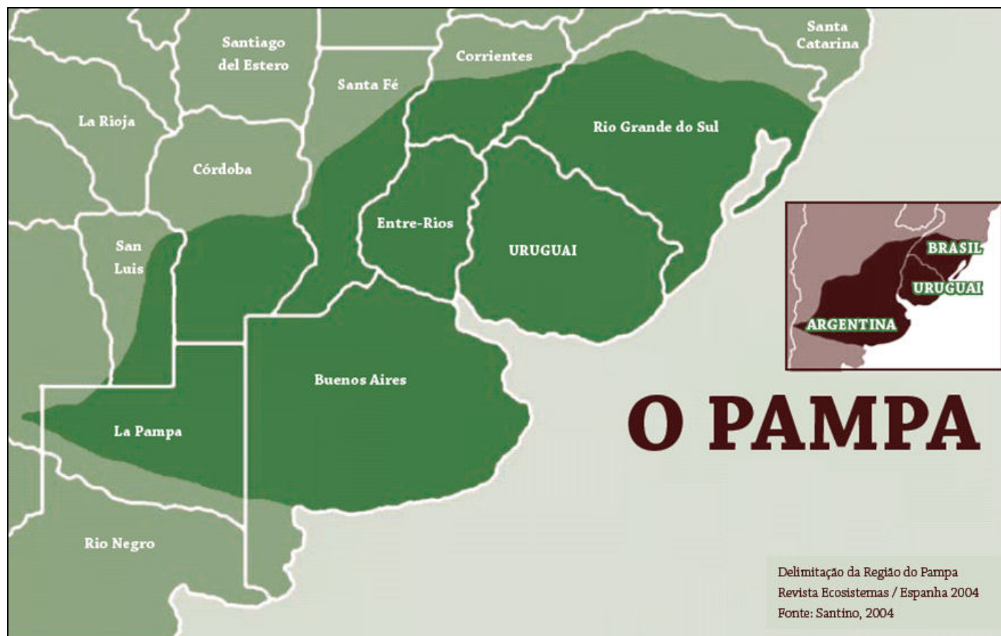
FIGURA 02 – MAPA do Bioma Pampa - Fonte: Retirado do livro " O Pampa em disputa: A biodiversidade ameaçada pela expansão das monoculturas de árvores " - Autor: Núcleo Amigos da Terra Brasil - NAT BRASIL